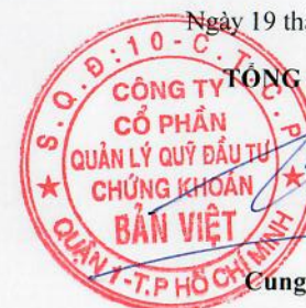
Cung Trần Việt